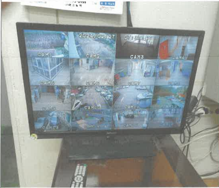
주차장 CCTV카메라 전원 복구