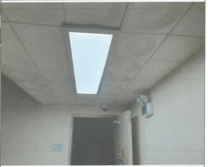
지하 2층 수영장 계단 쪽 천장 매립 등 점등 불량 안전기 1개소 교체