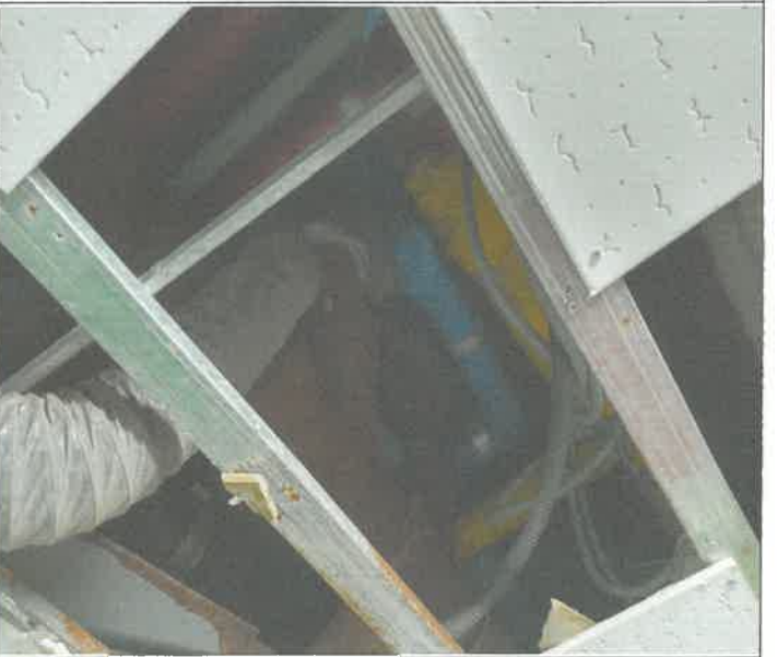
지하 1층 여자 화장실 천장 오수배관 누수 정비