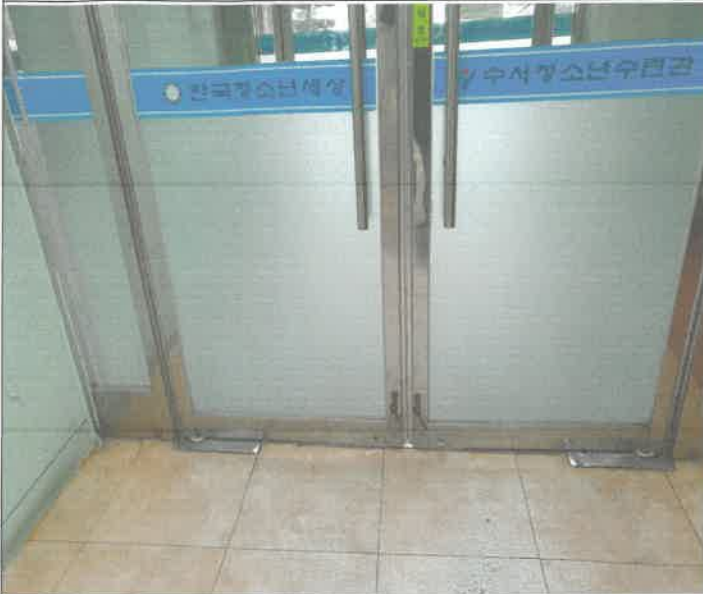
주차장 출입구 도어 스톱퍼 탈거 되어 제설치