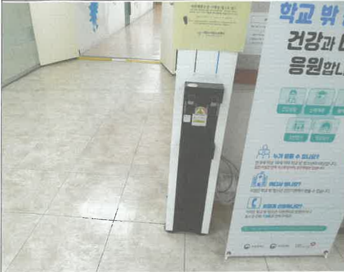
2층 정수기 콘센트 제 설치