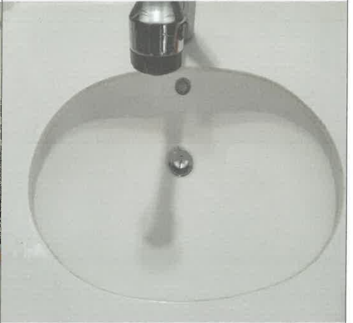
수영장 남자 샤워실 세면대 품업 교체