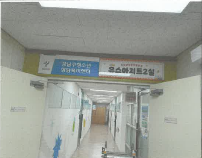
2층 복도 유스아지트2실 명판 부착