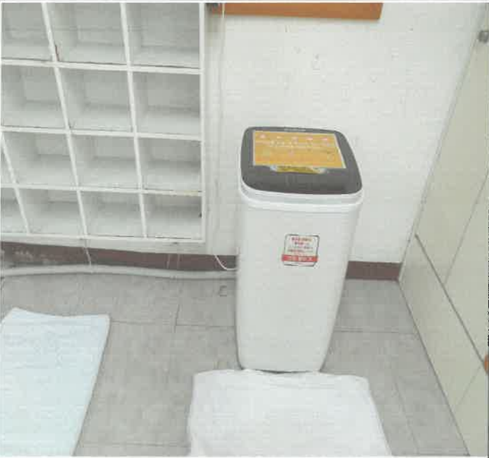
여자 락카실 탈수기 고정 작업