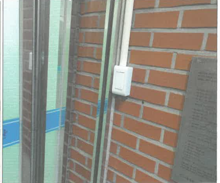
방과후 복도 외등 스위치 분리