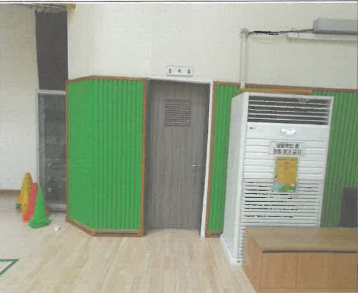
1층 대 체육관 준비실 나무 출입문 틀 보수