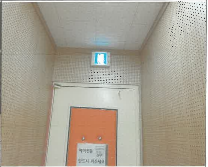
3층 드럼실 출입구 피난구 유도등 탈거 되어 제 설치