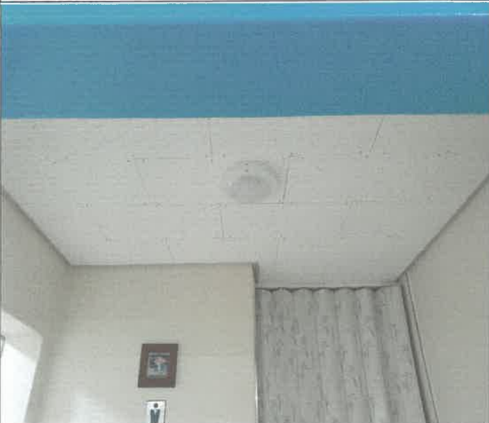
1층 남자, 여자 화장실 출입구 천장 센서 등 2개소 교체