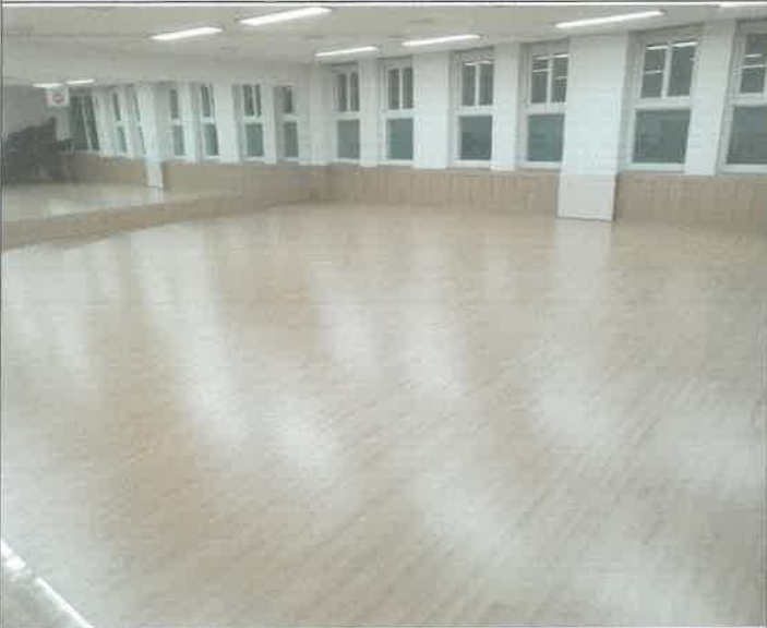
3층 강당 강화마루 틈새 간격 교정작업