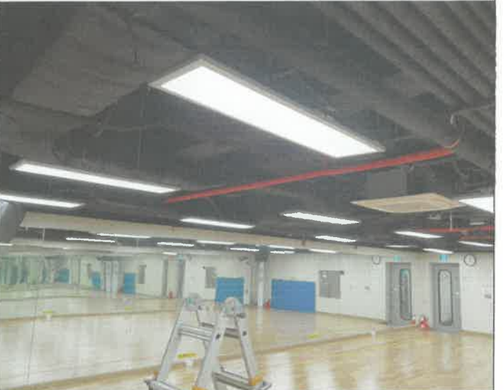
지하 1층 소체육관 천장 등 1개소 커넥터 불리되어 재 설치