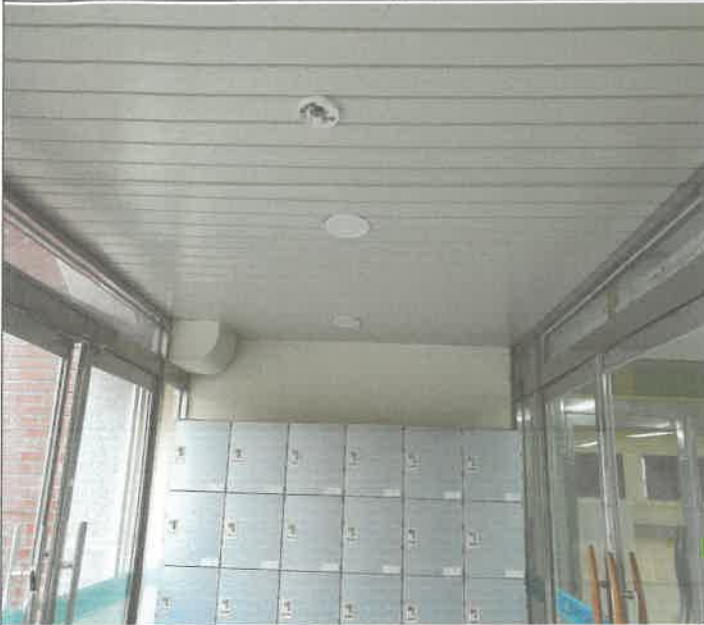
대체육관 앞 방풍실 천장누수 개소 누수물 유도로 임시 설치