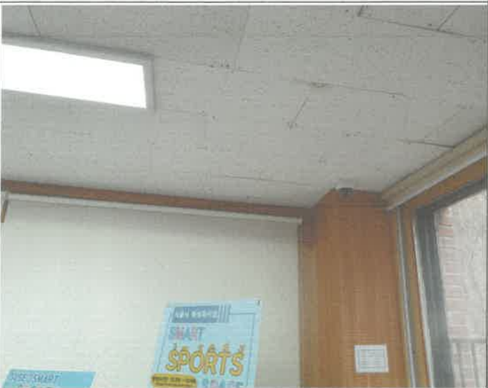
3층 스페이스실 천장 텍스 탈거 되어 제 부착