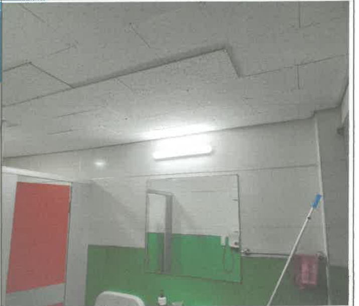
지하 1층 여자 화장실 천장 텍스 부착