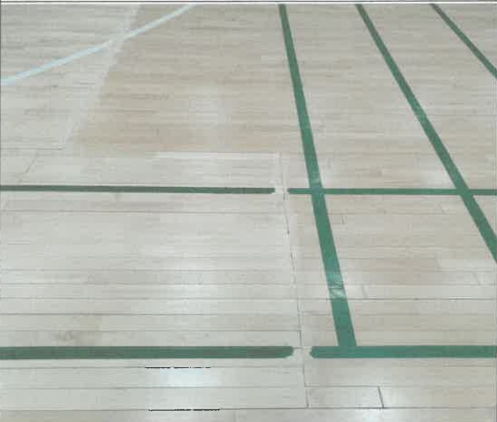
대체육관 마루보수개소 마감개소 샌드페이퍼 작업