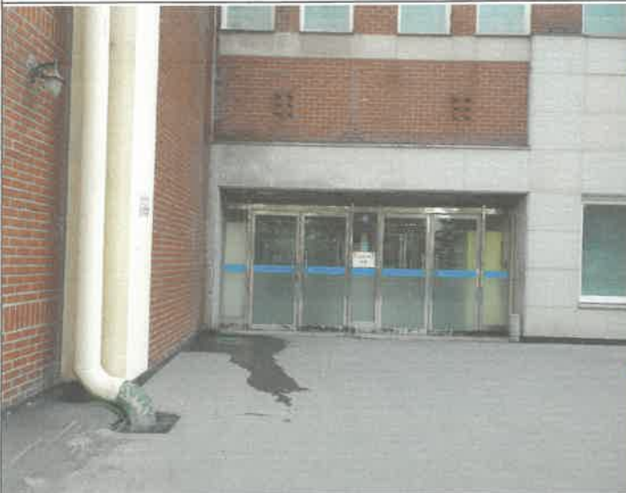
체육관 방풍실 외벽 도색