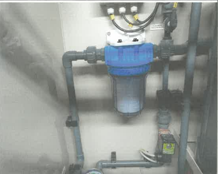
염소 발생기 물 필터 교체