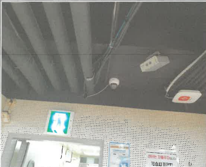
지하 소체육관 CCTV 카메라 이전 설치