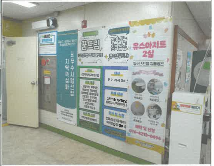
2층 복도 배너 광고 벽 설치