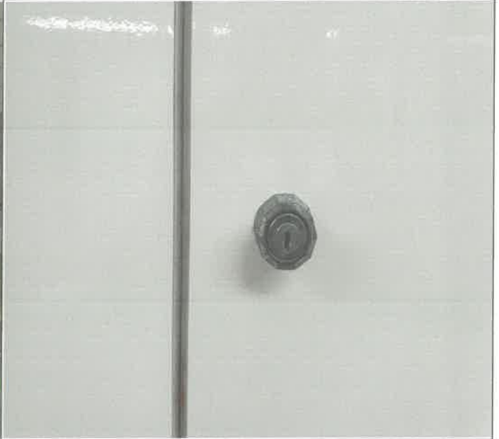
수영장 여자 탈의실 락카 키뭉치 1기 교체