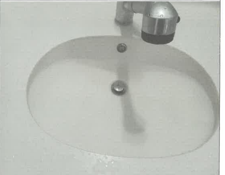
수영장 여자 샤워실 세면대 품업 교체