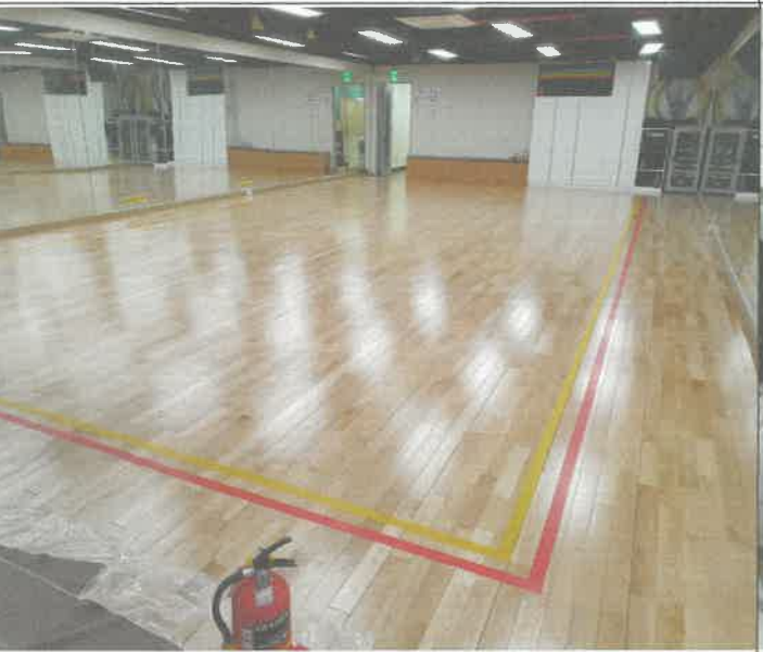
지하 1층 소체육관 바닥 안전 라인 구역 설정