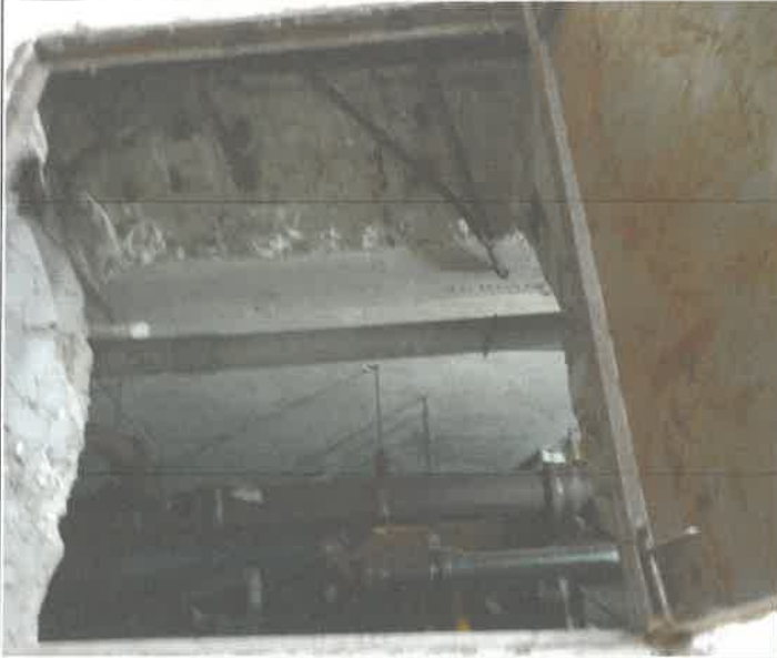
기계실 오수 비트 배수관 누수 정비