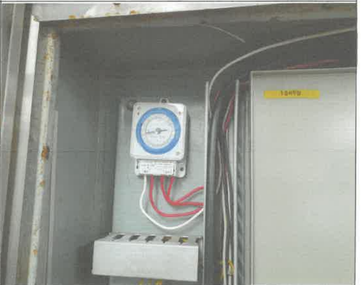
주차장 가로등 타이머 시간 조정