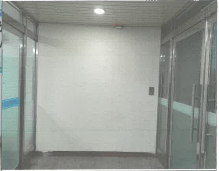
1층 체육관 복도 방풍실 도색