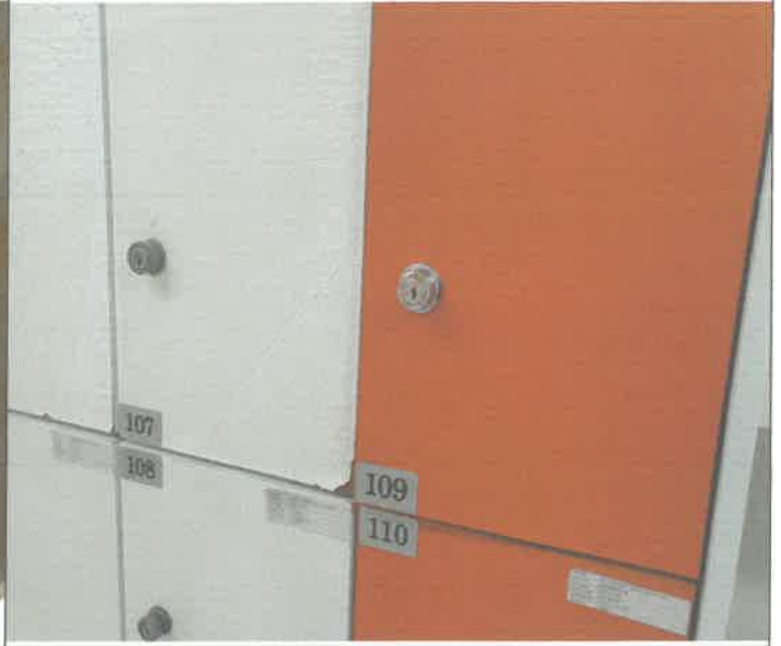
수영장 여자 락카1기 키뭉치 교체